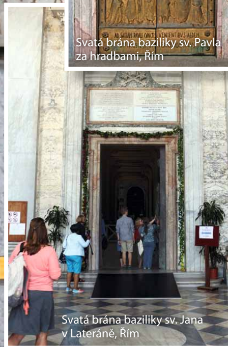
Svatá brána baziliky sv. Jana v Lateráně, Řím

Snímek na pozadí: zazděná Svatá brána ve vatikánské bazilice sv. Petra. V době mezi svatými roky jsou svaté brány ve čtyřech hlavních papežských bazilikách nejen zavřeny, ale dokonce zevnitř zazděny