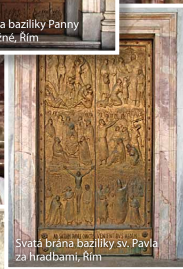
Svatá brána baziliky sv. Pavla za hradbami, Řím