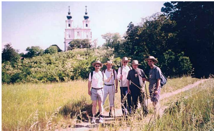
Poutníci 17. května 2000, v pozadí bazilika Bolestné Matky Boží v Maria Dreieichen...

V terénu však hranice vůbec nerozeznáte. Moravský břeh Dyje je stejný jako ten rakouský. Na italské straně hranic je stejná příroda jako na rakouské. Hranice jsou opravdu něco nepřirozeného a umělého. Proto můžeme být jen rádi, že v nové Evropě už hranice mezi státy nejsou tím, čím byly v minulosti, že nastal volný pohyb osob i zboží. Proto jsme také děkovali Bohu, že už padla železná opona. A chápeme radost tvůrců