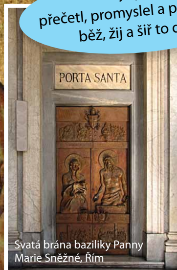
Svatá brána baziliky Panny Marie Sněžné, Řím

Když jsi to přečetl, promyslel a promodlil, běž, žij a šíř to dál!